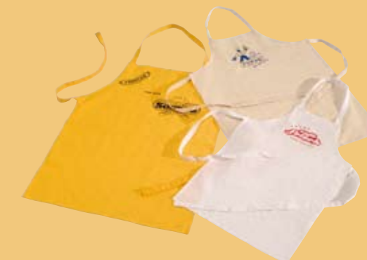
Latz-Schürzen, auch mit variablen Trägern – passend für jede Größe