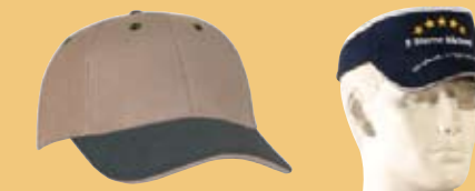
Baseballcap oder Bäckermützen