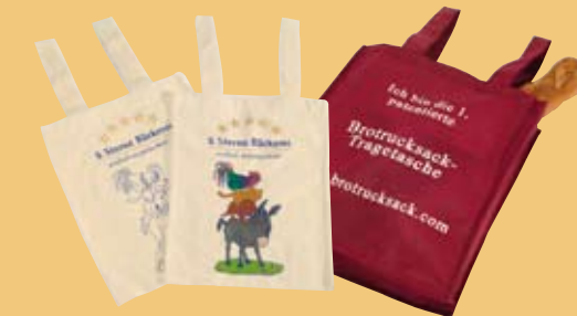
Brotrucksäcke, z. B. auch für Kinder zum Bemalen