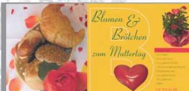
Eher werbewirksam als ertragreich war die Lieferung von Blumen und Brötchen vor die Haustür.

Info: Kerler GmbH, Tel. (075 63) 91 00-0, www.brotrucksack.com