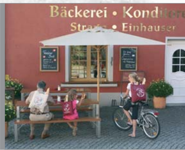
Mehrwert für den Kunden: Die praktischen Brotrucksäcke lassen sich als Tasche und als Rucksack verwenden.